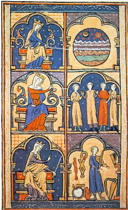
Een laatmiddeleeuwse (ca. 1300) voorstelling van drie soorten muziek (Bibliothèque Médicis Florence)

Gedurende deze examencampagne werd nauwelijks melding gedaan van examens die qua techniek niet goed functioneerden. Door de aanpassing van de videoplayer in Autoplay deden de problemen uit 2015, met het vastlopen van computers tijdens het afspelen van video's, zich niet meer voor.