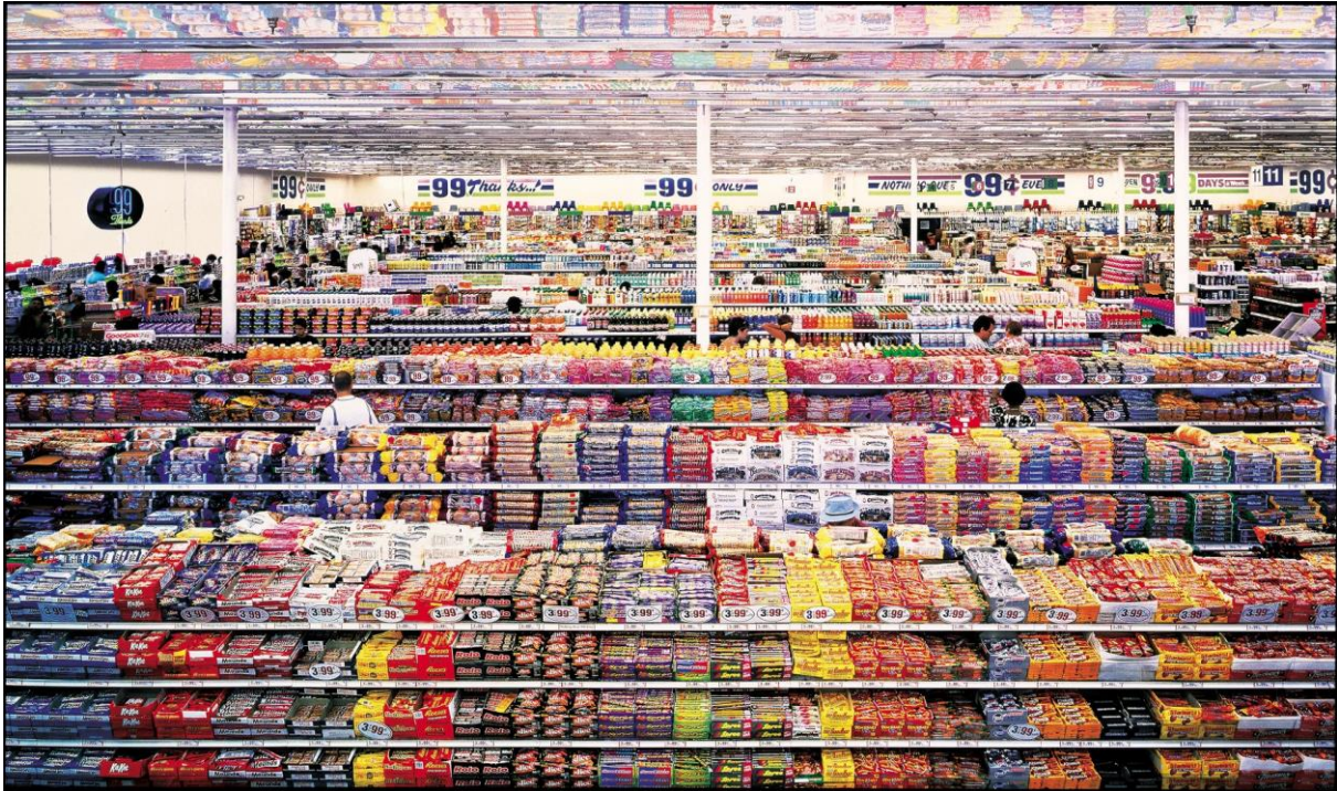
Andreas Gursky, 99 cent , 1999

Vraag 12 viel op doordat deze, hoewel relatief makkelijk (p' waarde van .73), een zeer goed onderscheid maakte tussen zwakke en sterke kandidaten: kandidaten die goed scoren op het hele examen, scoren ook goed op deze vraag.