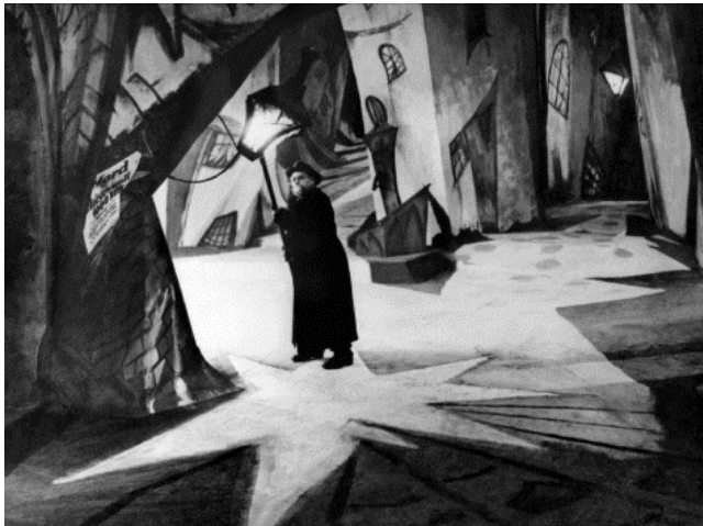
filmstill uit Das Cabinet des Dr. Caligari , 1920

Een verklaring voor de slechte score op deze vraag werd tijdens een van de examenbesprekingen aangedragen: "Het begrip toonvang wordt door veel kandidaten verkeerd geïnterpreteerd. Er wordt een antwoord geformuleerd over dynamiek (hard en zacht) en niet over de omvang (het bereik in toonhoogte)". Een andere vraag die veel commentaar kreeg van docenten was de eerste vraag van het examen. De formulering van de vraag zou onnodig ingewikkeld zijn, er werd gesproken over 'het streven naar uniformiteit van de Kerk van Rome'. De p-waarde van .58 geeft aan dat het grootste deel van de kandidaten deze vraag goed wisten te beantwoorden.