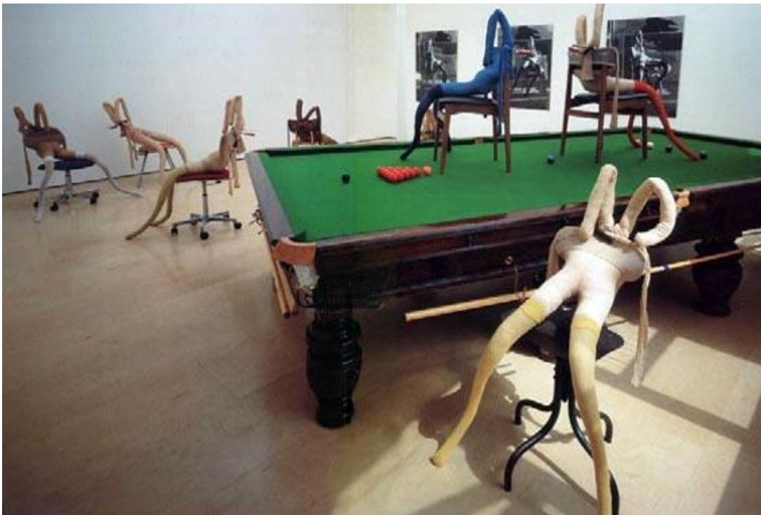
Sarah Lucas, Bunny gets snookered , 1997

Uit de analyse bleek dat vanaf vraag 30 een groeiend aantal kandidaten vragen onbeantwoord liet. Bij vraag 30 was dat 5% en bij vraag 37 was dat 9%.