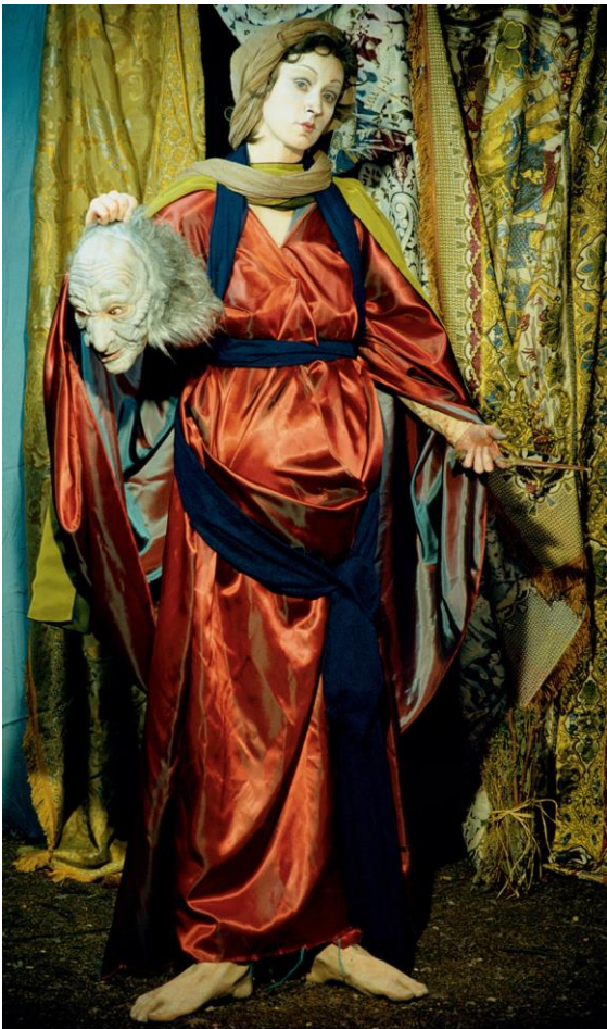
Cindy Sherman, Untitled #228 , 1989-1990