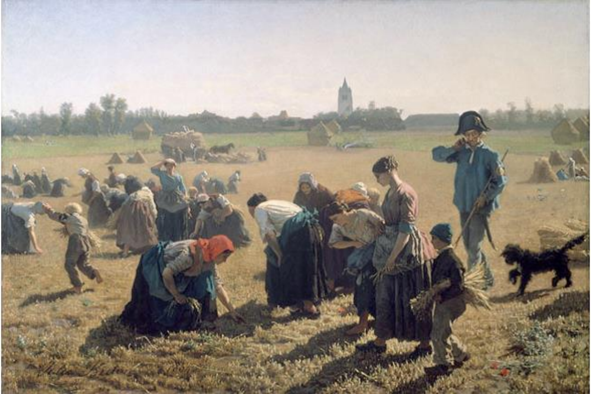
Jules Breton, Les Glaneuses , 1854